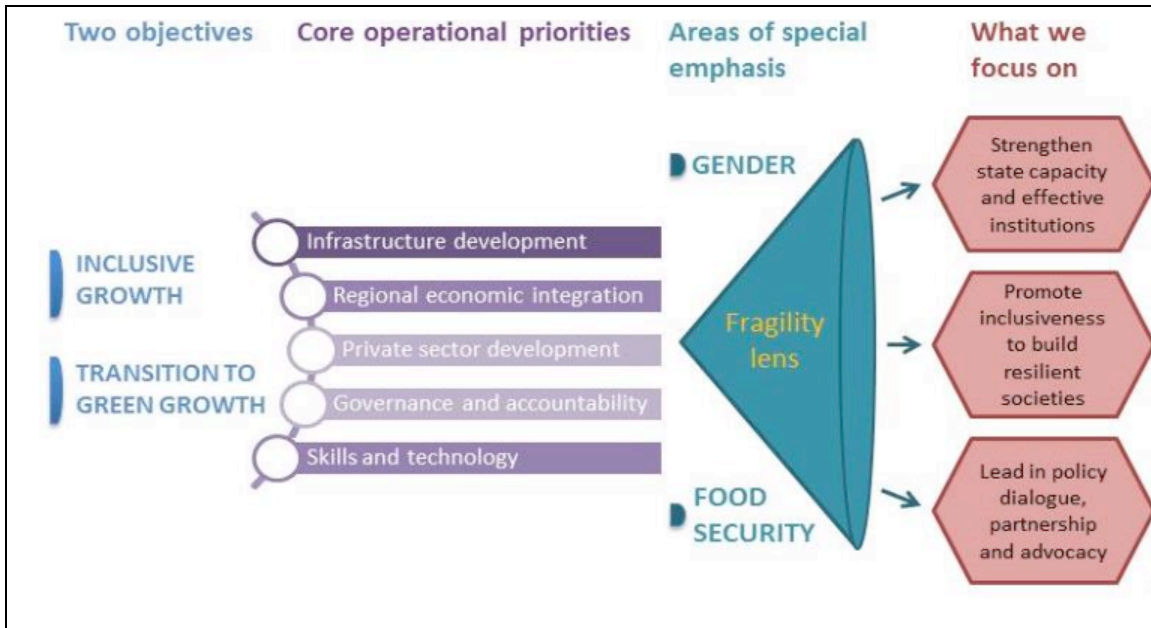
Figure 1: Contributing to Strengthening Fragile States